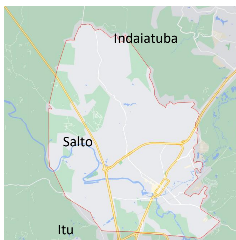
Figura 1: Mapa do Município de Salto